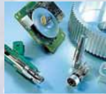
Teilereinigung in Industrie u. Werkstatt