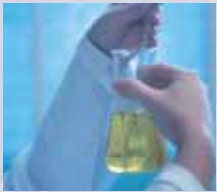
Reinigen, Entgasen und Dispergieren im Labor