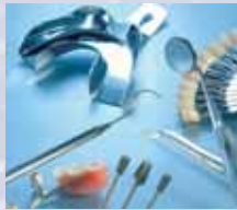
Reinigen in der Dentalbranche und Medizin