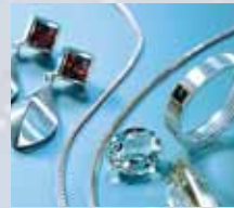
Ultraschallreinigung in der Schmuckbranche