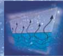
Degas und Autodegas

Die Elmasonic S Ultraschallgeräte bieten praktisch alle technischen Möglichkeiten, die heute bewährt und bekannt sind. Die neuen Geräte unterstützen die Wirkung des Ultraschall jetzt noch besser.