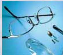
Ultraschall in Optik und Ophthalmik