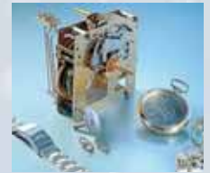
Ultraschall in der Uhrenbranche

■ Labor: Ultraschall reinigt überall dort, wo auch die Reinigungslösung hingelangt. Speziell geeignet für die Reinigung von Laborinstrumenten aus Glas, Kunststoff oder Metall. Mit den Elmasonic S-Geräten werden im Labor HPLC-Lösungen entgast, es wird gemischt, dispergiert, emulgiert und gelöst. ■ Medizin: Intensive Reinigung von chirurgischen und medizinischen Instrumenten, von Mikronstrumenten ohne Materialbeschädigung oder Reinigung von Starren Endoskopen und flexiblem Endoskopzubehör.