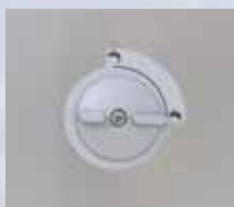
Ablaufbedienung seitlich frei positionierbarer Ablauf

Die Elmasonic S Geräte umfassen ein Spektrum von 13 Gerätegrößen mit einem Tankvolumen von 0,5 bis 90 Liter. Sie sind mit 37 kHz effizienten Ultraschall-Leistungsschwingern der neuesten Generation ausgestattet.